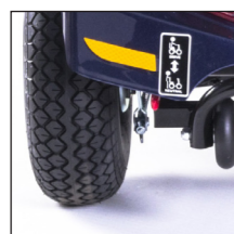
750W Motor 750W Moteur

Jetzt noch stärker! Maintenant encore plus fort!