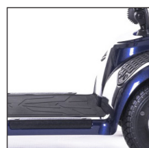
Niedriger Einstieg Accès plus bas