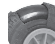
Nagelschutz Sauvegarde clou