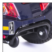
Rammschutz Barre de protection